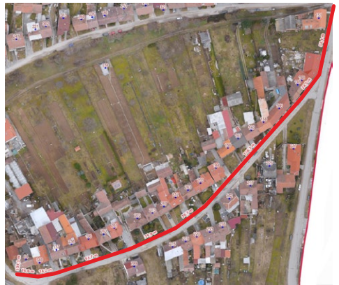
Chodník Krpile – 360 m

délka je přibližně 360 m a předpokládané náklady se pohybují v rozmezí 1,5–2 mil. Kč. Významná část chodníku leží stále na pozemcích soukromých majitelů a proto nyní probíhají jednání o majetkovém vypořádání, aby se obec mohla o chodníky naplno starat a mít za ně odpovědnost. Začátek prací očekáváme v průběhu května až června, pokud vše půjde, jak má.