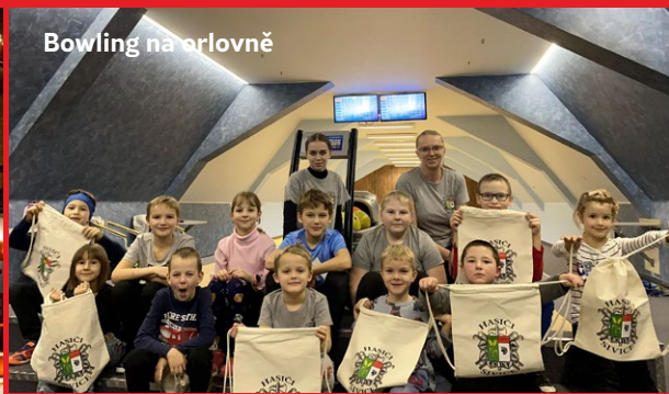
Bowling na orlovně