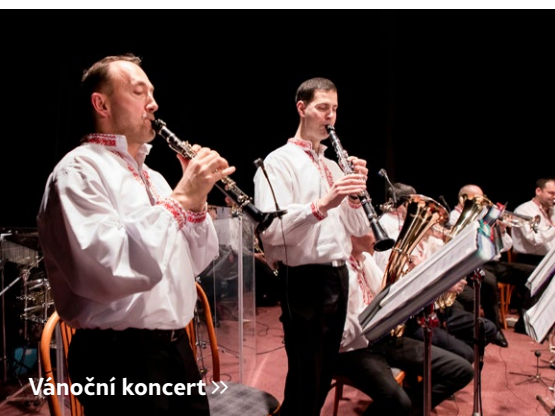
Vánoční koncert >>