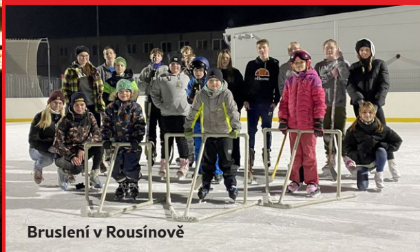
Bruslení v Rousínově