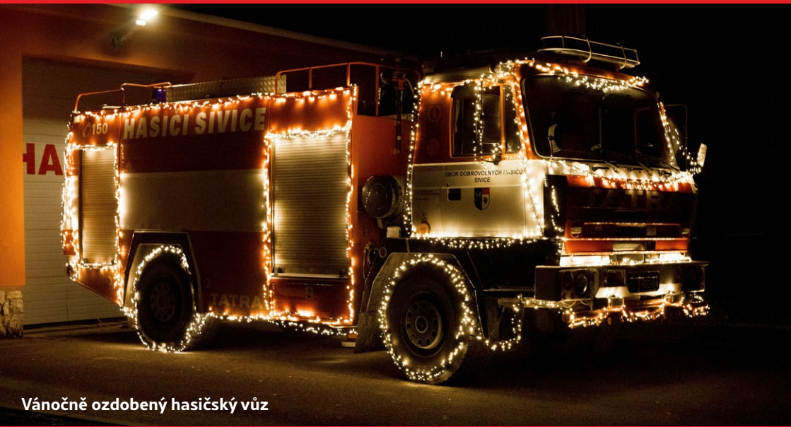
Vánočně ozdobený hasičský vůz