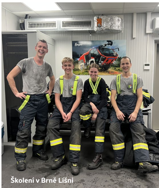
Školení v Brně Líšni

Školení se účastnilo 14 hasičů ze 3 sborů. Na začátku nás čekal 30 m výstup na nekonečném žebříku, po kterém následoval 90 vteřinový běh. Po fyzické části se dvojice hasičů ihned přesunula do klecového polygonu, kde za nulové viditelnosti v plně zakouřeném prostředí a za neustálého křiku dítěte, měli zdolat všechny nástrahy polygonu. Hasiči byli pod neustálým dozorem instruktorů, kteří přes infra kamery